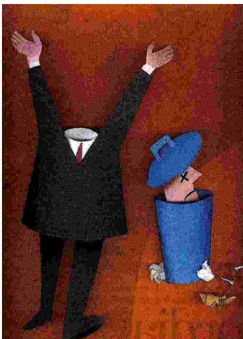
Illustrazione di Gianni Chiostrì

Capite, cari lettori, in quali condizioni si andrà a votare, domenica prossima, in sette regioni italiane? Resta un dubbio: che questa confusione, in fondo, non dispiaccia poi tanto a chi compila le liste elettorali.