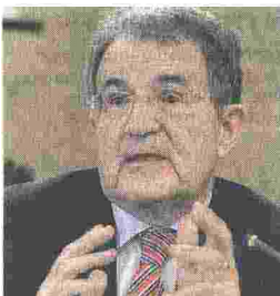
EX PREMIER Romano Prodi

In 'Missione incompiuta' (a cura di Marco Damilano) l'ex premier riapre i capitoli più spinosi della carriera