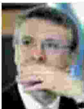
Raffaele Cantone