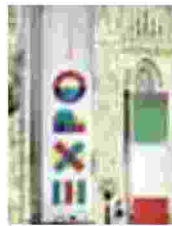
Bandiere dell'Expo

SULL'ITALICUM NON SI TORNA INDIETRO O SAREBBE IL "BOMBA LIBERA TUTTI". SCISSIONE? BERSANI LA SPIEGHI AL POPOLO DEMOCRAT