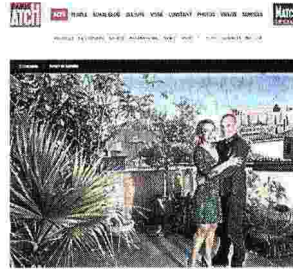
La terrazza sul Partenone

NOI GRECI, PROPRIO COME VOI ITALIANI, ABBIAMO PROBLEMI CON IL SENSO DELLO STATO MA SIAMO BRAVI A FLAGELLARCI