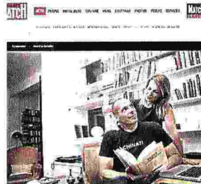
Con la moglie