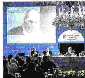
Al Workshop Ambrosetti