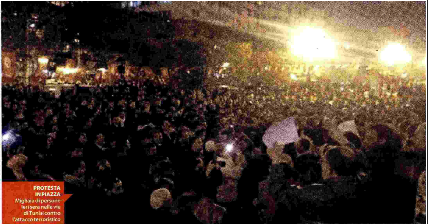
PROTESTA IN PIAZZA Migliaia di persone ieri sera nelle vie di Tunisi contro l'attacco terroristico