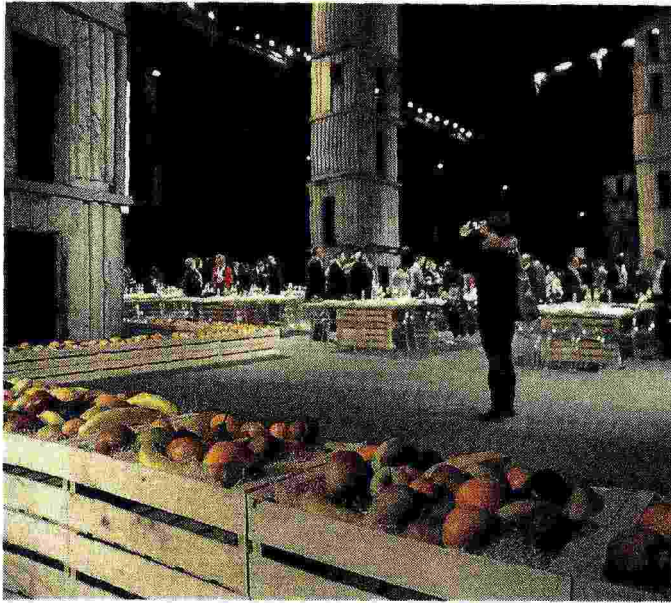
L'hangar della Biccocca

PELLI IMPROCRASTINABILI CHE LA terra ci rivolge per la sua custodia e salvaguardia, il rispetto dei diritti delle generazioni future. Per tutti occorre che l'Expo diventasse l'occasione per far risuonare il comandamento: «Ama la terra come te stesso!».