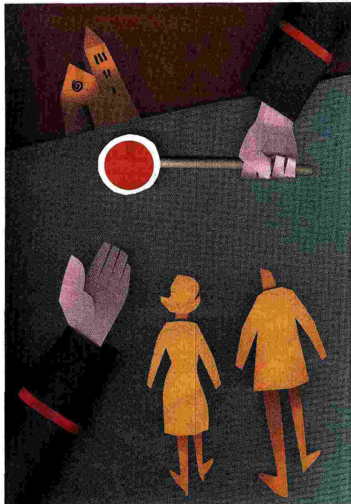
Illustrazione di Gianni Chiostrì