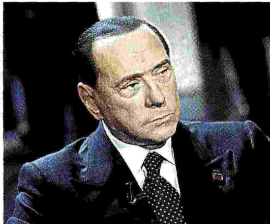
Il presidente del Consiglio Matteo Renzi durante l'intervista con il Messaggero