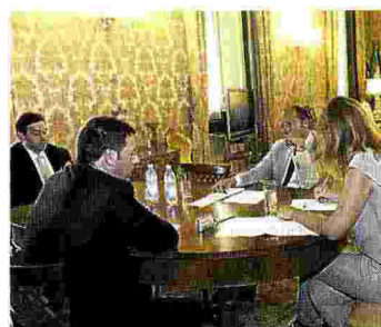
Sopra, un momento dell'intervista nello studio di palazzo Chigi