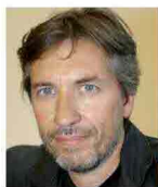
di Mauro Magatti

Lavoro, famiglia, figli: la ripresa oltre l'individualismo