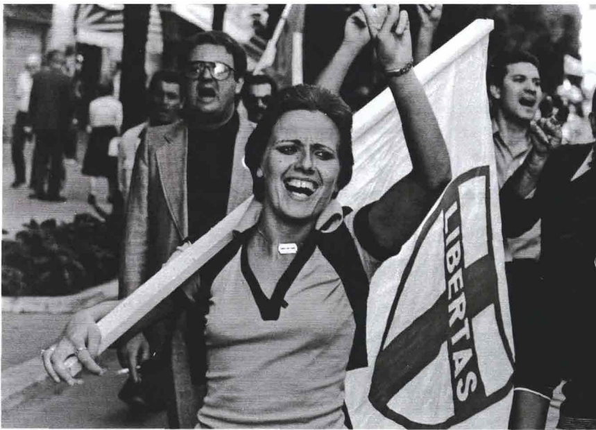
MILITANTI DC NEGLI ANNI SETTANTA. NELL'ALTRA PAGINA: DE GASPERI NEL 1948. SOTTO: LA LEOPOLDA