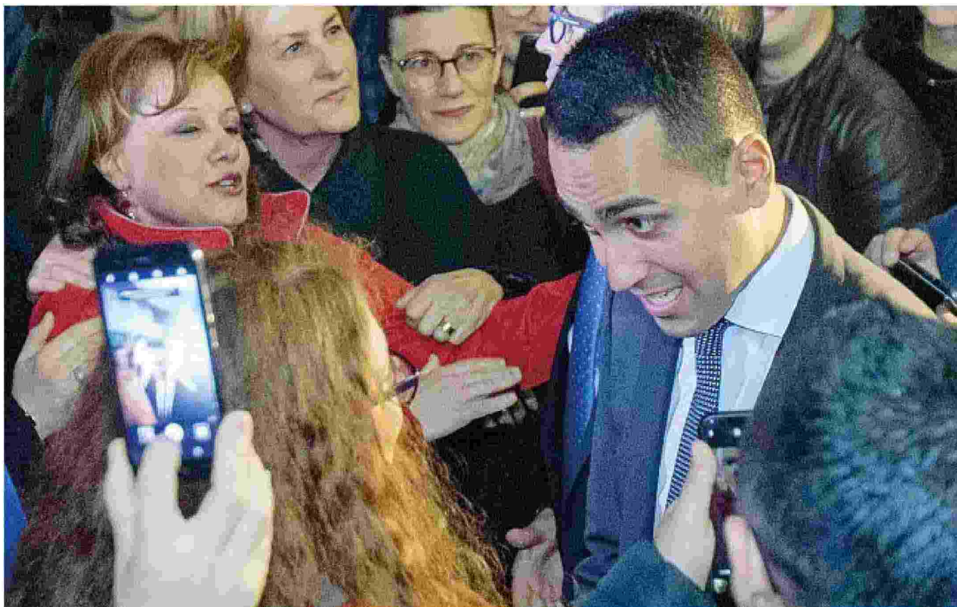
Il bilancio Il vicepremier e capo politico del Movimento 5 Stelle Luigi Di Maio, 32 anni, ieri a Matera per commentare l'esito del voto di domenica scorsa in Basilicata