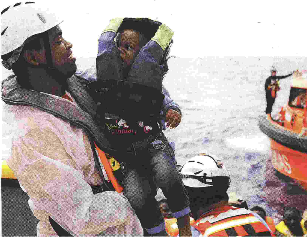
Un salvataggio di migranti al largo delle coste libiche da parte di una ong