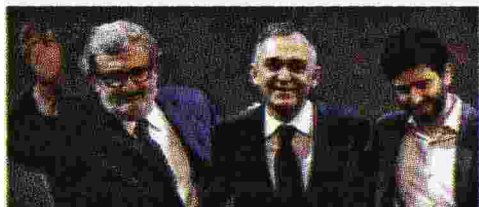
Michele Emiliano, Enrico Rossi e Roberto Speranza

> Oggi la direzione del partito, Renzi e i bersaniani non ci saranno. Emiliano continua a trattare > Letta: "Non può finire così". Il ministro Orlando si candida alla segreteria: sfido l'ex premier