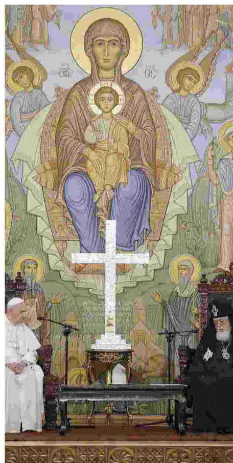
Francesco con il patriarca della Chiesa ortodossa di Georgia, Ilia II

Intervista a Francesco alla vigilia della chiusura del Giubileo: «Mi sono semplicemente lasciato portare dallo Spirito Santo. Non avevo piani. È stato un processo maturato nel tempo»