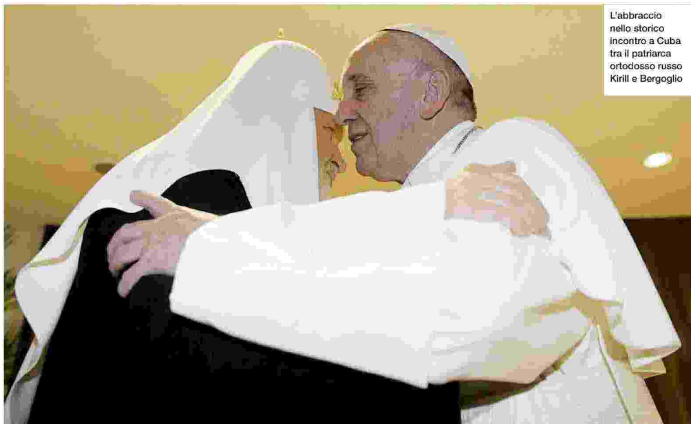
L'abbraccio nello storico incontro a Cuba tra il patriarca ortodosso russo Kirill e Bergoglio