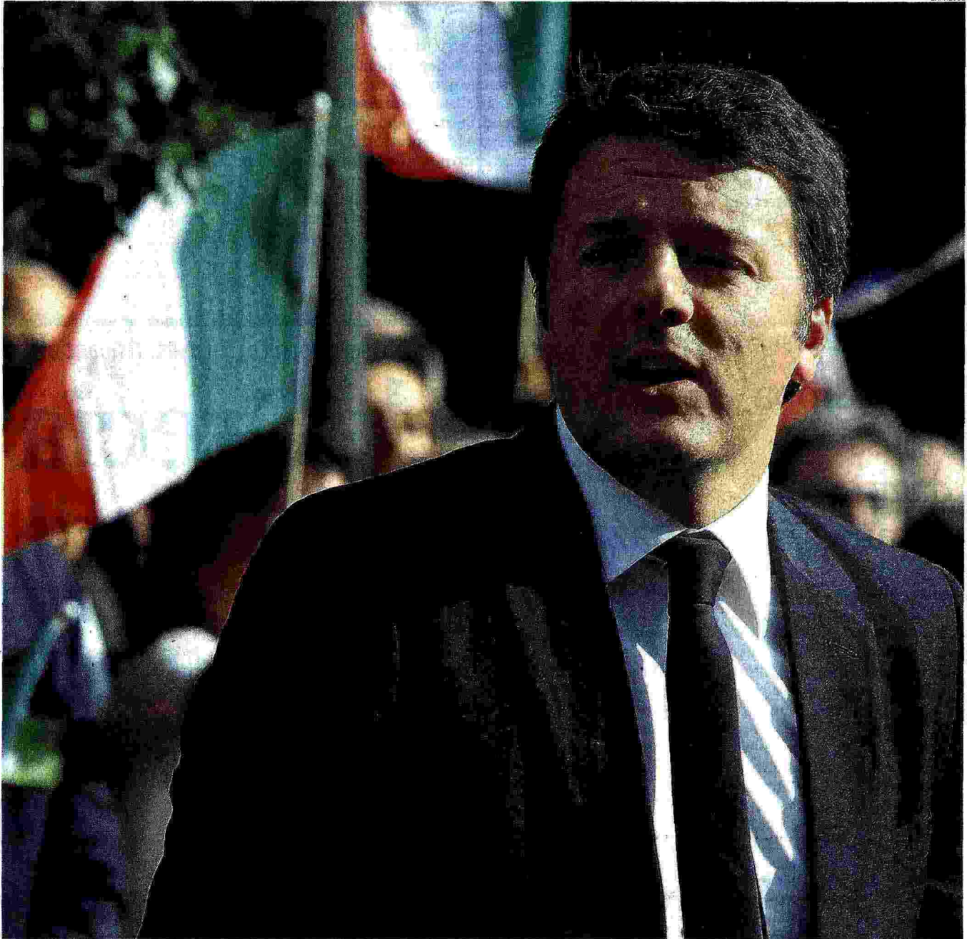
Il presidente del Consiglio. Matteo Renzi