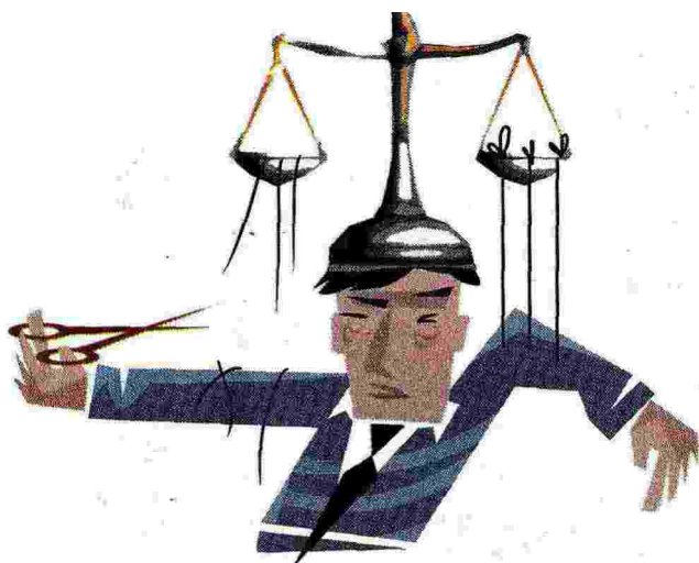
Illustrazione di Irene Bedino