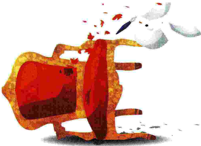
Illustrazione di Irene Bedino