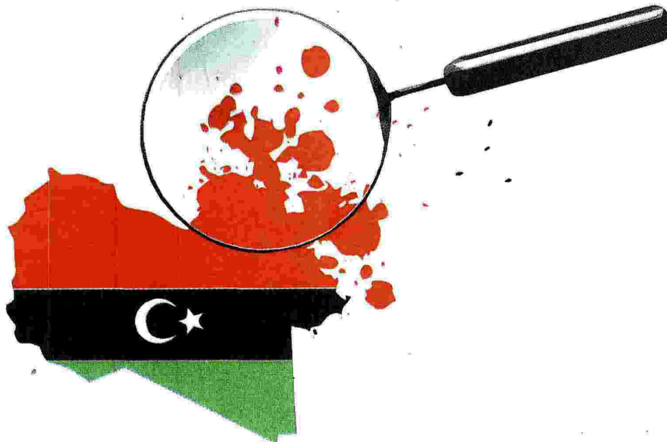
Illustrazione di Irene Bedino