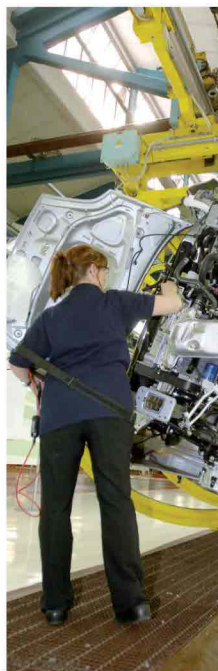
Il lavoro è la priorità del Pd

Renzi porti fino in fondo le sue osservazioni sulla flessibilità e le garanzie. Il nuovo Codice del lavoro può essere varato in tre mesi, perchè ora otto?