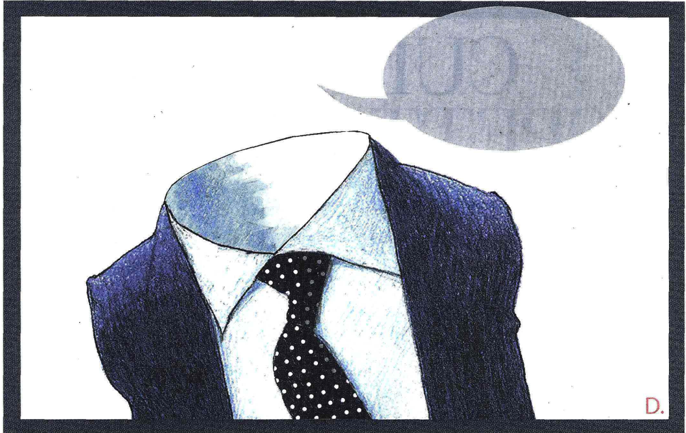
Illustrazione di Dariush Radpour