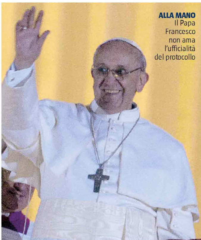
ALLA MANO Il Papa Francesco non ama l'ufficialità del protocollo

L'ora in cui il Papa celebrerà domenica la messa per la Giornata della Gioventù nel Campus Fidei a Guaratiba