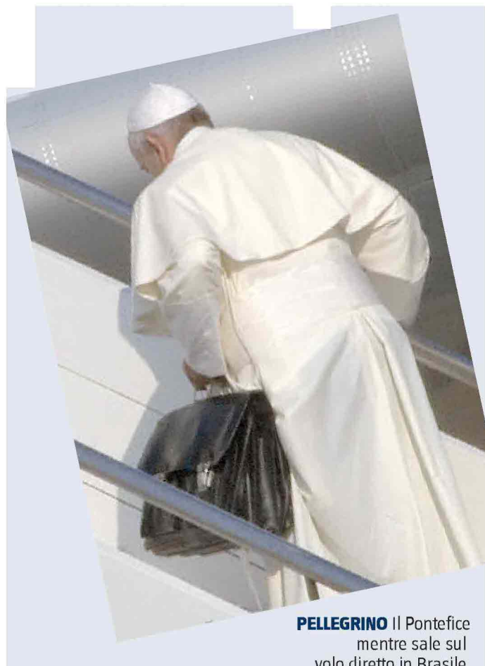
PELLEGRINO Il Pontefice mentre sale sul volo diretto in Brasile