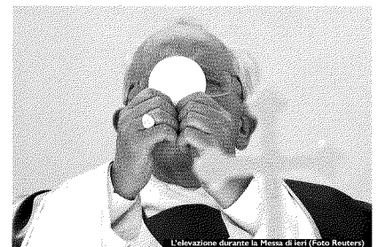
L'elevazione durante la Messa di ieri