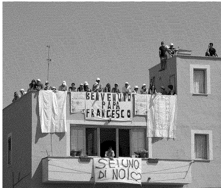
Ha raggiunto anche i tetti delle case, l'entusiasmo per l'arrivo di Francesco a Lampedusa. Un'attesa, una gioia che poi si sono tradotte in grande partecipazione alla Messa presieduta dal Papa

«Chi ha pianto per la morte di questi fratelli e sorelle? Per le persone sulla barca? Per le giovani mamme che portavano i loro bambini? Per questi uomini che desideravano sostenere le loro famiglie? Siamo una società che ha dimenticato l'esperienza del piangere, del "patire con"»