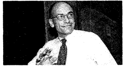
Il premier Enrico Letta

Se Letta cambia il paese io sto con Letta, se questo significa che sta al governo per 20 anni, va bene. Non ho ambizioni personali, ma per il paese