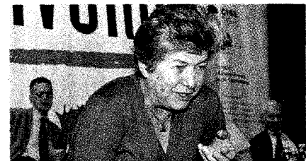
Susanna Camusso, segretario della Cgil

«L'allarme della Cgil che dice che l'Italia ripartirà solo nel 2076, quando si tornerà agli stessi livelli di occupazione pre-crisi, è terrorismo psicologico»