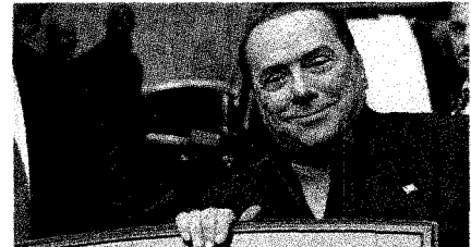
Il leader del Pdl Silvio Berlusconi

Non voterei l'ineleggibilità di Berlusconi: sono 19 anni che viene eletto, non è che perché viene eletto ci si inventa il giochino dell'ineleggibilità